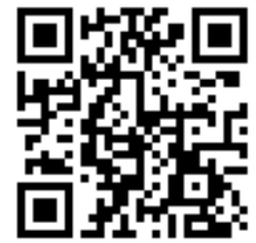
長照 E 申請 (請掃描 QR code)