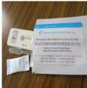
2. 取出內容物: 試劑 卡、滴管、乾燥包