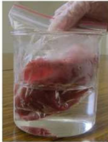
2. 泡入熱水(約90℃) 約10秒