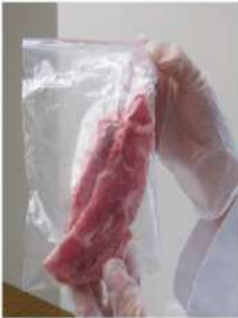
1. 將肉放入塑膠袋內