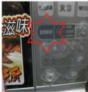
2. 使用最低功率微波 約10~20秒