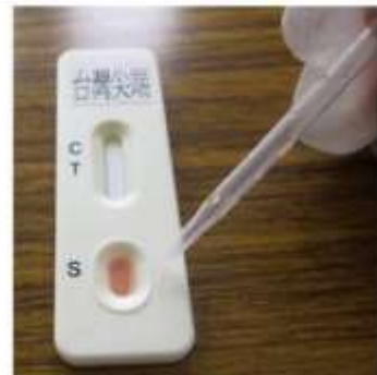
3. 以滴管取肉汁， 滴三滴於S內